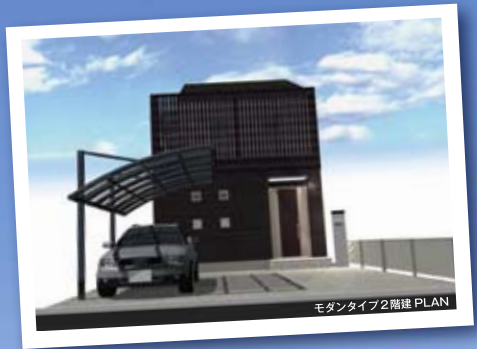
モダンタイプ2階建 PLAN